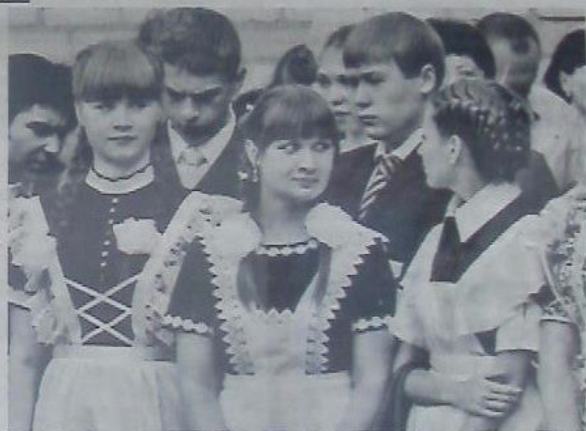
◆ На школьной линейке старшеклассники СШ №13.

Желательно выбрать школьную одежду, в которой минимальное количество сложных застёжек и завязок, потому что такую одежду ребёнку будет легче